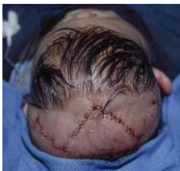
斜頭蓋形成術後の皮膚縫合状態