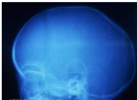
舟状頭蓋単純レントゲン

小児脳神経外科チームが診療にあたり、症状のある場合には可能な限り学童期早期までに手術的加療を行うことを検討します。