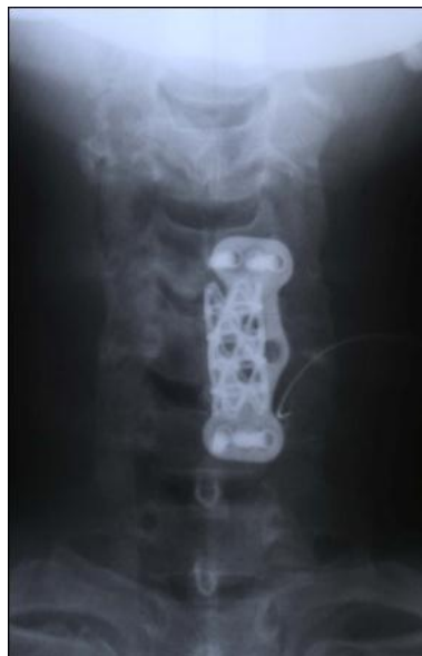
頸椎レントゲン術後正面像