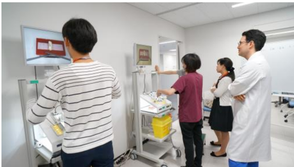
米国外科学会の Fundamentals of Laparoscopic Surgery (FLS) に基づいたトレーニング（聖路加シミュレーションセンター）